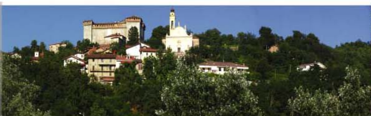
L'imponente castello Adorno e la vecchia Pieve che domina Silvano d'Orba.

Locanda Caneyari , via De Antoni, 32 - Volpedo - Tel.013180589 Crema di gianduja, nocciole, pesche di Volpedo e sorbetto alla grappa